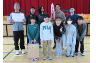
優勝した長浜 A チームの皆さん

良いプレーのたびに会場のあちこちから歓声があがり、白熱した試合が展開されました。