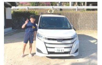
滝川内子ども会による広報

4月6日(月)~15日(水)まで、「春の交通安全県民運動」期間となっていました。公用車による広報を行ったり、各地区で有線放送による広報を行っていただきました。