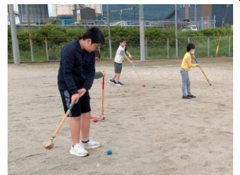
令和7年度大会の様子

●問合先 子ども会連合会事務局(東山代コミュニティセンター内) ☎28-0001