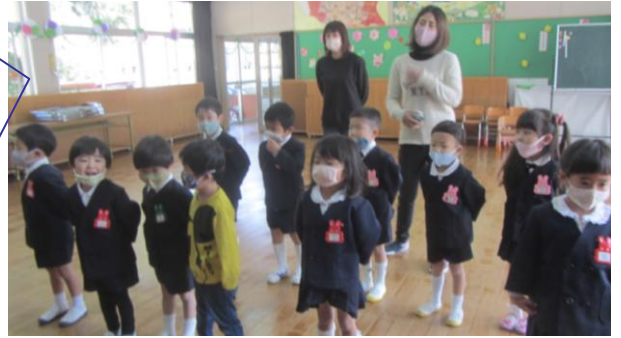
朝日興産様より「マグネットブロック」を頂きました。

令和3年度がスタートしました。始業式では、自分で鞆を持つことと、交通ルールを守ることのお話を聞きました。