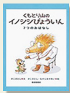
『くもとり山のイノシシぼういん ~7つのおはなし~』 かこさとし/文・絵 なかじまかめい/絵 福音館書店

山のふもとにある小さな病院の院長をしている、モジャモジャ髪の毛のこわい顔をしたイノシシ先生のもとへ、山のみんながやってきました。うさぎの看護師さんが入ってきたのは、マスクをつけたカマキリさん。鼻をクチュクチュ、くしゃみや鼻水が出ています。ちよの粉でも花粉のせいでもなく、先生は考え込みました。するとカマキリさんは、ヤギばあさんに白い花が咲いている所で追いかかれた話をしました。