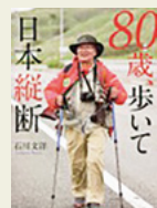
『80歳、歩いて日本縦断』 石川文洋/著 新日本出版社

戦場カメラマンとして命がけで世界を巡った著者の夢は、歩いて日本の風景を見ることでした。心筋梗塞で身体障害者手帳を受け手術を経て、80歳で3500kmの日本縦断を実行。宗谷岬から那覇市までの11か月に渡る記録です。カメラマンとして思う存分撮影しながら、東北の被災者との交流や旧友との再会など、人とのふれあいを通し、平和な日本を満喫する様子が記されています。