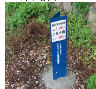
有田川河口（頭無し樋門脇）