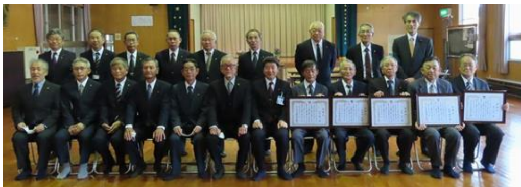
「副市長、市議、新旧駐在員で記念撮影」