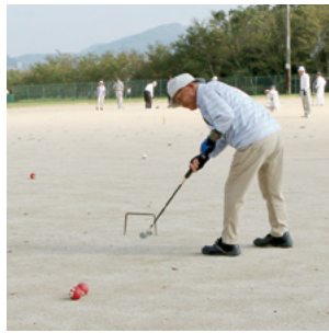
↑ 昨年の大会の様子(令和2年9月10日)