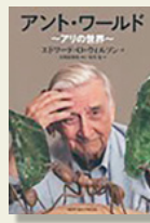
『アント・ワールド』 エドワード・O・ウィルソン/著 大河原 恭祐/監訳 川岸 史/訳 ニュートンプレス

幼い頃から生物が好きな著者は、家の周辺や公園に出かけ、自然界への興味を深めていきます。13歳の時、自分の住む地域に生息しないはずのヒアリを発見。それは、運命の出会いともいえる発見で、やがて彼は科学者、生物学者になる決意をします。90歳を過ぎ、アリの研究対象として過ごした日々を顧みながら、アリの生態やアリの世界の熾烈な戦いなどを分かりやすく語ります。