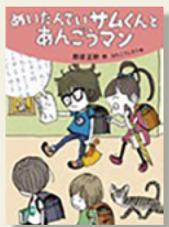
『めいたんていサムくんとあんどマン』