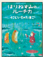
『はりねずみのルーチカ 10〜にじいろのたまご〜』 かんの ゆうこ / 作 北見 葉胡 / 絵 講談社

ある朝、ルーチカは真珠色に輝く、美しい卵が落ちていたのを見つけた。何の卵かわからないので、動物や植物に詳しい、やぎのクレーエさんに聞いてみることにしました。でも、図鑑にも載っていない卵でした。すると、「見て！内側から生き物が卵をついている！」。見ると、卵は虹色に変わり、銀色に光る二つの目がくるんと動きました。