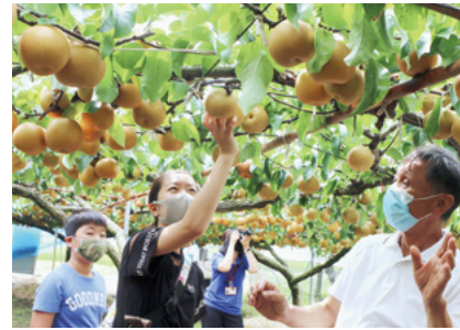
↑ 梨の収穫方法や見分け方を教わりながら梨狩りを楽しむ来園者