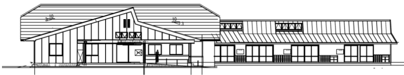
コミュニティセンター入口