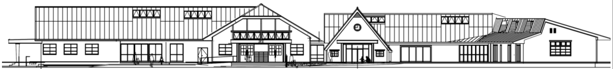
コミュニティセンター