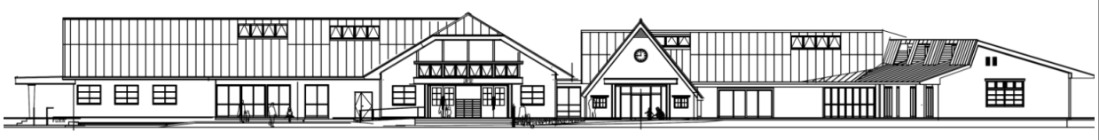
コミュニティセンター