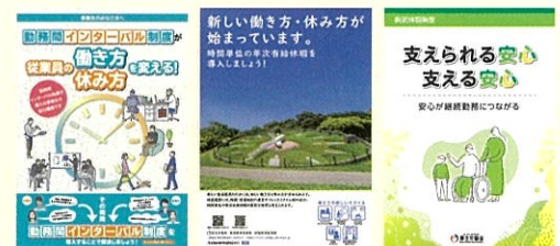
各制度に関するリーフレット（例）

「勤務間インターバル制度」「時間単位の年次有給休暇制度」「特別な休暇制度」などについて、企業の取組事例の紹介や、リーフレットなどの資料を掲載しています。自社における制度検討の参考にご活用ください。