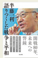
『半藤一利語り つくした戦争と平和』 半藤 一利/述 保阪 正康/監修 東京新聞

『歴史探偵』の半藤一利が亡くなった一年。本書は、盟友の保阪正康などとの対談をまとめたものです。「大事なことはすべて昭和史に書いてある」と語る半藤さんは、東京大空襲の体験から絶対に戦争をしてはいけないと考えます。「問い直す戦争 忘れてならない教訓」「分断と格差の世界 歴史から学ぶものは」と、戦争の悲惨さや愚かさを知る世代が少ない今、半藤さんの遺言として読んでほしい一冊です。