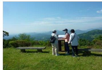
昨年の大野岳コース

地域に残るありのままの風景を楽しみながら歩く「フットパス」、寄り道・道草をしながら自然や町並みの風景、地域の方との交流と一緒に体験してみませんか。今回は、9月4日(日)に「重橋本庄コース(4.5km)」を歩きます。ご参加をお待ちしています。