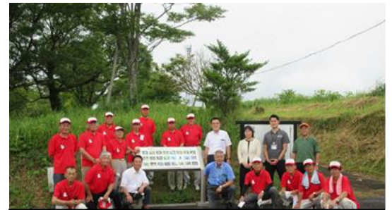
除幕式のあと看板を囲んで、来賓の皆さんと保存会の皆さんで記念撮影 ※頂上周辺は「生活環境保全林」として市民の憩いの場として整備されています

8月6日(土)には、看板の除幕式が行われました。来賓の方々からは、保存会と南波多郷学館の生徒によるシバハギの植栽などの活動に対して敬意が表されました。大野岳の自然は、地域の様々な人々の手で守られています。皆さんも現地に行って蝶や野鳥たちを観察し、大野岳の自然を感じてみませんか?