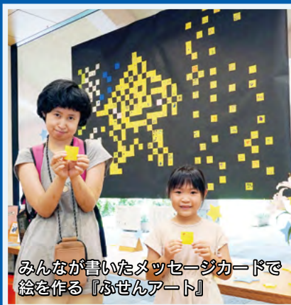
みんなが書いたメッセージカードで絵を作る『ふせんアート』