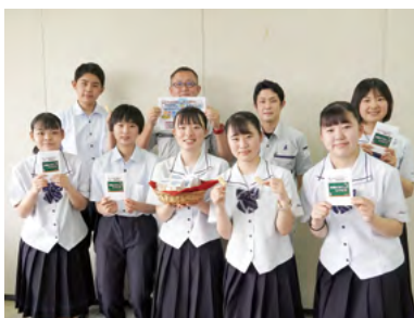
↑お魚ビスケットは、魚の風味と塩味が楽しめると話す部員と社員

お魚ビスケットは、7日と21日に、Aコープ伊万里店での販売も行われ、多くの人が買い求めていました。