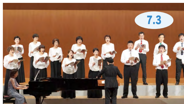
↑ふるさと伊万里の情景を思い巡らす四季のメドレーなどで観客を魅了させる団員たち

伊万里合唱団の定期演奏会が、3年ぶりに市民センターでありました。コロナ禍で大変な思いをしている人がいる中、「頑張る皆さんを合唱団らしく歌声で応援したい」との思いが込められたハーモニーが会場に響きます。この日は26曲が披露され、来場者からは「心から楽しむことができた」、「来年も楽しみ」との声が聞かれました。