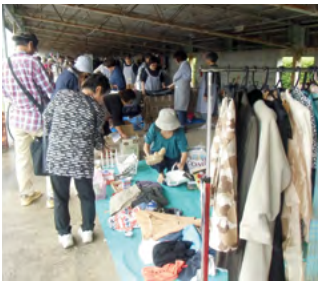
↑令和元年度開催の様子(令 和2・3年度は中止)