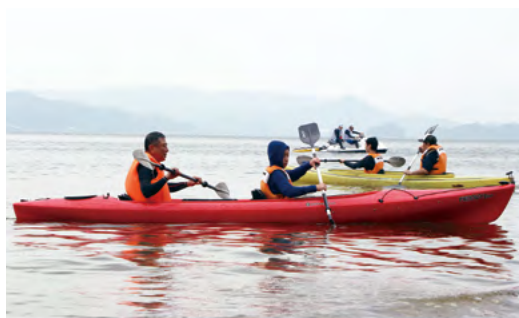
↑令和元年8月に開催したチャレンジキャンプのカヌー体験