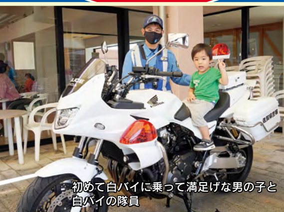
初めて白バイに乗って満げな男の子と白バイの隊員

3年ぶりとなった『図書館☆まつり』は、7月9・10・17日に分けて開催し、市民の皆さんと一緒に、図書館の誕生日を祝いました。