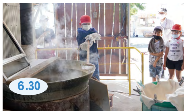
↑釜の熱さに耐えながら、結晶になった塩をすくい上げる児童

波多津小学校の4年生が、『地域を学ぶ』ための校外授業に参加しました。漁業について話を聞いたあと、船で伊万里湾に出航して、伊万里港湾の開発などについて学びました。また、NPO法人まちづくり波多津が行っている塩づくりも体験。児童は「塩づくりは、手作業が多くてびっくりした。熱い中で作業して、すごいと思った」と話しました。