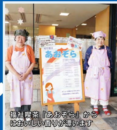
福祉喫茶『あおぞら』からはおいしい香りが漂います