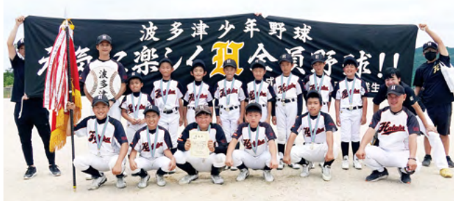
↑市長旗大会での初優勝を喜ぶ波多津少年野球の選手たち