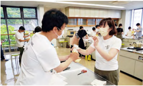
↑ポリ袋調理法における唯一の失敗が袋を破ることと聞き、慎重に調理する参加者

ば缶と切り干し大根のスープなど4品を作り、参加者は、「災害時に調理器具がないことが、十分に考えられるので、勉強になった」と話しました。