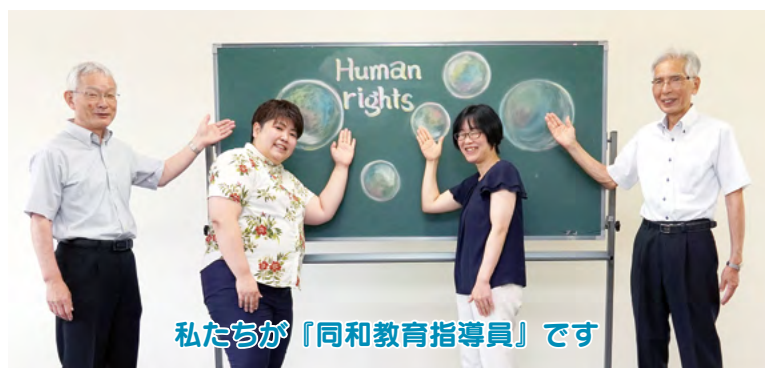
私たちが「同和教育指導員」です