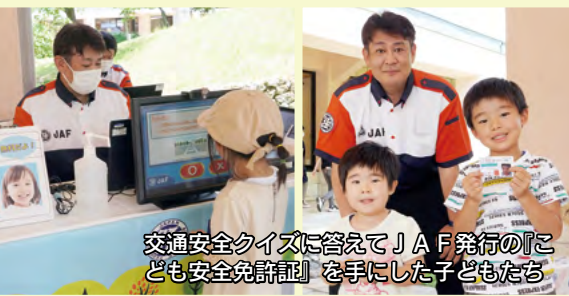
交通安全クイズに答えてJAF発行の『子ども安全免許証』を手にした子どもたち