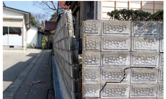
↑地震のあと、倒壊しかかっているブロック塀