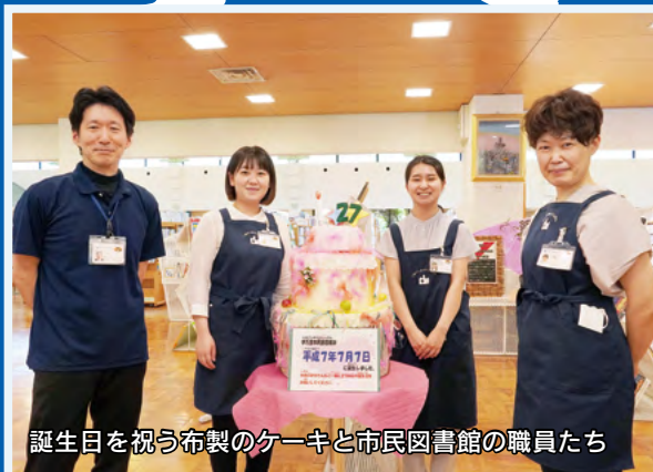
誕生日を祝う布製のケーキと市民図書館の職員たち