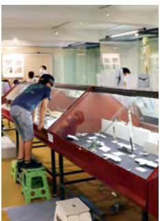
↑令和3年開催の様子