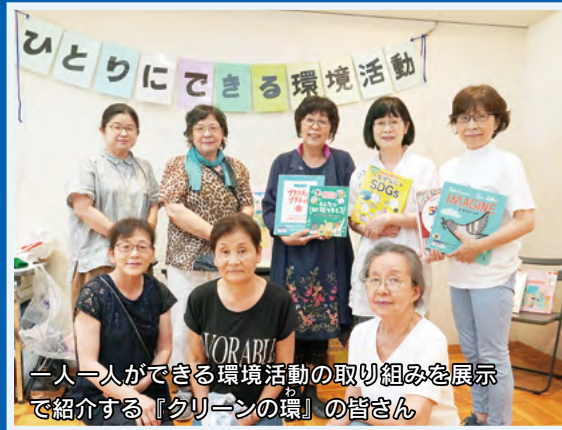
一人一人ができる環境活動の取り組みを展示で紹介する『クリーンの環』の皆さん