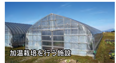
加温栽培を行う施設