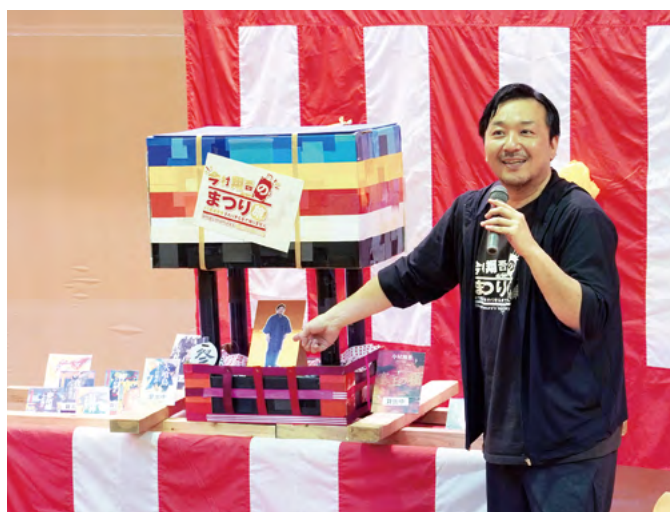
↑市民図書館の司書が飾った『だんじり』などでまつりを演出した会場で講演する直木賞作家の今村さん

6月15日、第166回直木賞を受賞した作家の今村翔吾さんの講演会とサイン会が、市民図書館でありました。これは、『今村翔吾のまつり旅』47都道府県まわりきるまで帰りません』と題し、5月に出発して9月まで、11泊119日かけて車で全国を巡り、講演やサイン会を開催される旅の一環で、早田書店（二里町）と市民図書館が共同で企画に応募し、開催が決まったものです。会場には、市民図書館の司書が手作りしたトントントン祭りのだんじりを飾るなどし