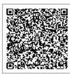
↑こちらで確認できます

※使用可能店舗や販売場所は、市が発行した『第3次伊万里エールクーポン券』や『伊万里がんばろう応援券』とは異なります。