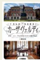
『カーザ・ヴェルディ』 藤田 彩歌/著 ヤマハミュージック エンタテインメント ホールディングス

イタリア・ミラノにある高齢者施設。ここは世界でもまれな、引退した音楽家たちのための施設です。音楽家が引退後も、生涯音楽的な生活ができるようにと、偉大な作曲家・ヴェルディの願いを込めて設立されました。ここに、ひよんなことから住むことになった20代の若き音楽家の卵たち。豊かな人生経験と輝かしい功績を持った同居人たちと、奇想天外、ユニークで音楽的な毎日を過ごします。音楽を通して生まれる、かけがえのない交流と伝承。そこには、年齢の垣根など全く感じさせません。