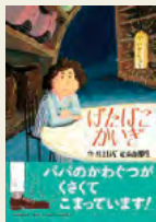
『げたばこかいぎ』 村上 しいこ/作 高島 那生/絵 PHP 研究所

「はるとくん、起きてください」はるとの右足のスニーカーに呼ばれて、連れて行かれたのは、なんとげた箱。はるとは、靴たちが集まる『げたばこかいぎ』に呼ばれたのです。そこには、パパの革靴やママのブーツ、妹の長靴の姿もあります。話は、パパの革靴が臭くて困っているというもので、はるとからパパに伝えてほしいと言っています。