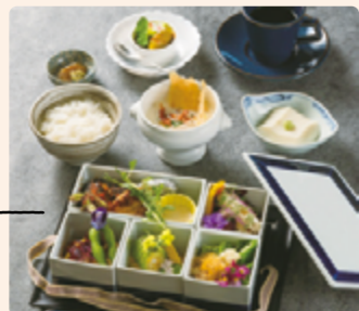
ビストロ エヴァンカドゥー

たくさんのハーブや食花を使い、見た目にも工夫しています。味と香りをお楽しみください。