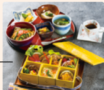
すし料理専門店 亀井鮨

色鮮やかな茶碗蒸しをはじめ、すし職人歴52年の技が光る五つの鶏料理。それぞれにダンが効いた奥深い旨みは絶品。