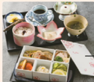
レストランまるいし