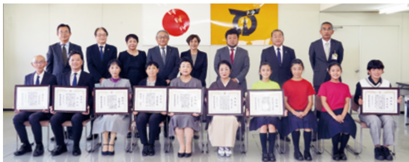
↑市教育委員会表彰受賞者の皆さん(前列)