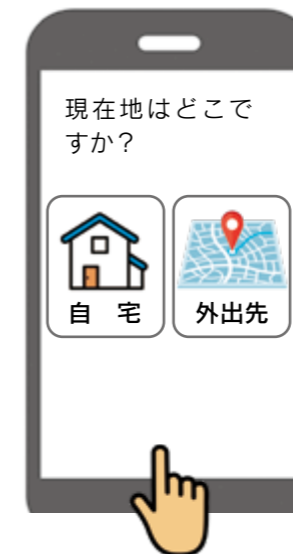
②『自宅』または事前に登録した『よく行く場所』を選択