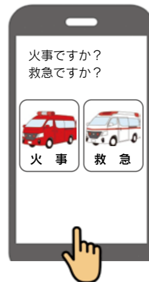
①『火事』『救急』のいずれかを選択