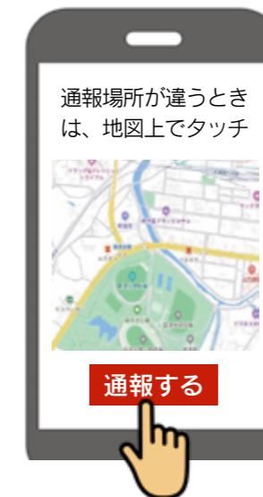
③『通報する』のボタンをタップして通報