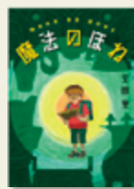
「魔法のほね」 安田 登/著 亜紀書房