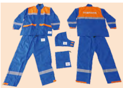
↑視認性や耐久性、作業性に優れた雨衣を整備

コミュニティ助成事業は、宝くじの収入を財源とする社会貢献広報事業で、安全なまちづくりなどに助成し、地域コミュニティ活動の推進を図るものです。今回の整備で、大雨時に活動する消防団員の安全性のさらなる向上が確保されます。