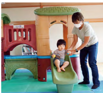
↑令和4年の夏に開設したキッズブルームで楽しむ親子