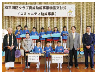
↑鍵盤ハーモニカなど6種類の楽器を受け取った鳴石保育園の園児たち