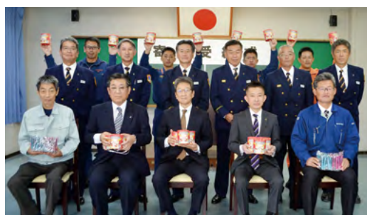
↑伊万里有田地区消防設備等保守協会の皆さん (前列)

今回寄付された懸垂幕と横 断幕は、市内や有田町内の施 設に設置する予定です。また、 トイレットペーパーやフード マグクリップは、火災予防の 啓発活動に使用されます。