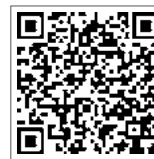
↑がんばろう応援券