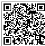
↑エールクーポン券

クーポン券と応援券は、現金での払い戻しができませんので、期限までに使用してください。