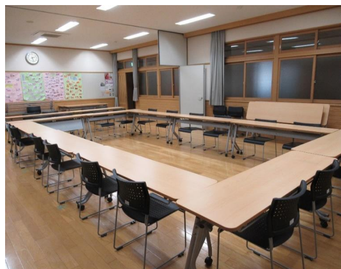
↑ 研修室①と②をつなげた状態