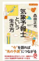
『気象予報士という生き方』 森田 正光/著 イースト・プレス

日本最年長のお天気キャスターである著者が、自身の経験を振り返りながら、業界の歴史や気象予報士の仕事内容を紹介。著者ならではの、波乱万丈の気象予報士エピソードは必読です。