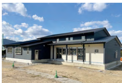
↑ 新しく建設した川東区自治公民館