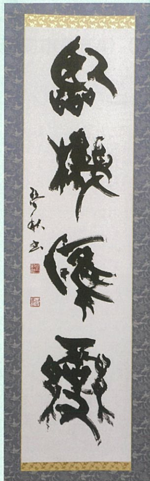
「臨機應変」 池田 啓二 作