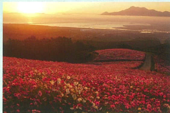
「高原の秋」 原 利男 作