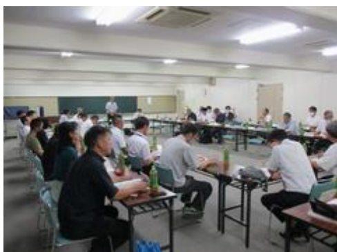
▲学校給食運営委員会

令和6年度は、活動費補助として100,000円、物価高騰による子育て世代の負担軽減のため、令和5年度と令和6年度の給食費増額分の1/2を補助するとともに、進学等に向け特に経済的負担が大きい中学3年生の給食費を無償化するための事業費補助として52,358,737円を交付し、経済的負担の軽減と子育て環境の改善、食育への関心向上に努めることができました。