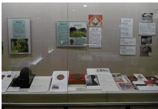
▲常設展 古代コーナー

また、出前講座、見学講座も年間11回実施し、小学生を中心に伊万里のすばらしさを伝えることができました。