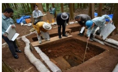
▲調査指導会議の様子