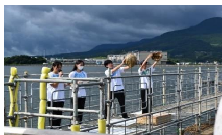
▲伊万里高校理化・生物部による解説の様子

カブトガニの産卵つがい数について、令和3年と令和4年は、平成28年～令和2年(5年間)の平均である522つがいの3倍近くの約1,500つがいを記録していましたが、令和6年は、258つがいを記録し、平均以下のつがい数となりました。この減少の実態を確認するため、令和7年度に産卵地一斉調査を行います。