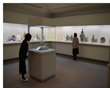
▲伊万里・鍋島ギャラリー

このほかに、大川内山の秋の窯元市に協賛して、伊万里・有田焼伝統産業会館においても本市が所蔵する古陶磁器を広く一般に展示公開しました。