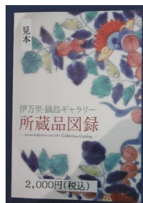
▲改訂版 所蔵品図録