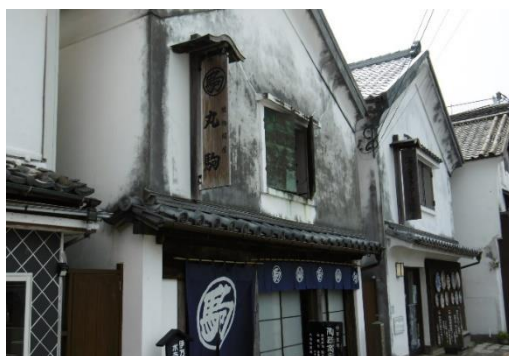
▲外観と丸駒の看板

令和6年度の入館者数は2,910人を数え、市内外からの来訪者へ、本市のやきもの文化や商人文化に関する理解を深めるとともに、市街地観光に貢献しました。