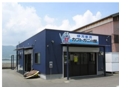
◀伊万里湾カブトガニの館

そのほかに、『佐賀県立伊万里高等学校理化・生物部』へのカブトガニ研究調査業務委託や『伊万里市カブトガニを守る会』に対し支援を行いました。