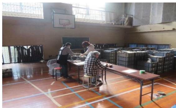
鈴桶遺跡出土遺物 再整理作業