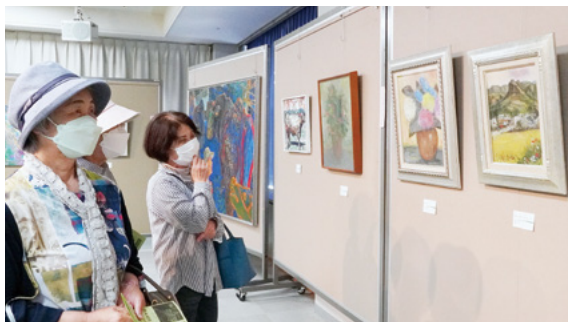
↑ 展示された絵画を鑑賞する来場者

絵画部門の鑑賞に訪れた市民は「構図や色の使い方などで作者それぞれに表現が違っているの、見ていておもしろい」と楽しそうに話してくれました。