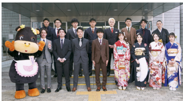
↑市民センターで記念撮影を行う式典の参加者

式典では、各地区・町から選出された20歳の代表者19人で構成した実行委員会が、昨年7月から会議を重ねて企画した内容で行われ『実行委員長の誓いのことば』や『思い出のフォトムービー』の上映