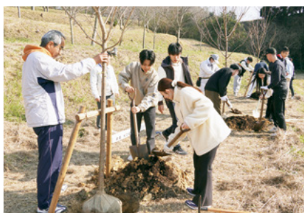
↑大川内造園の職人の皆さんに手ほどきしてもらい植樹を行う実行委員