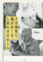
「犬が看取り、猫がおくる、しあわせのホーム」 石黒 謙吾/文・写真 光文社

横須賀市にある老人ホームで、最期のときを迎える老人たちの傍らに寄り添い、彼らを看取る犬や猫がいます。本書は、その老人ホームで11年間にあつた奇跡ともいえるエピソードが写真とともにつづられています。そこには、このホームでの取り組みを多くの人に知ってもらい、老人ホームの理念や実態、課題、老人福祉のこと、動物保護問題などに関心を持ってほしいという、著者の思いが込められています。