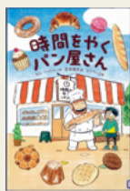
「時間をやくパン屋さん」 キム ジュヒョン/作 吉原 育子/訳 金の星社

隣の席のクラスメートと、かわいらしい女の子に見られてしまったピーター。最悪な気分のまま、いつもとは違う方向へ歩いていくと、そこには「時間をやくパン屋さん」が。「わた雪たつぷりパンドーロ」(どきどき初恋ケーキ)など、変な名前のパンがいっぱい並んでいます。どうやら覚えておきたい時間をパンに込めてやくと、食べるたびにそのときの味がよみがえるらしいのです。