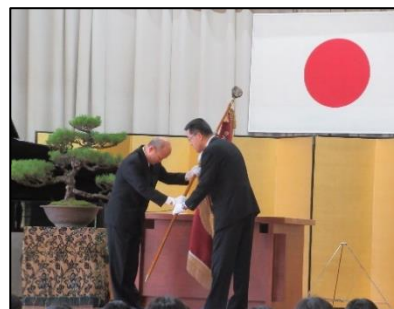
第1部「閉校記念式典」

3月30日(日)に大川小学校の閉校式が行われ、153年の歴史に幕を閉じました。地域の方々にも、多数のご参加をいただきありがとうございました。