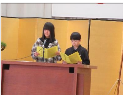
第2部「ありがとう大川小学校」 在校生による発表