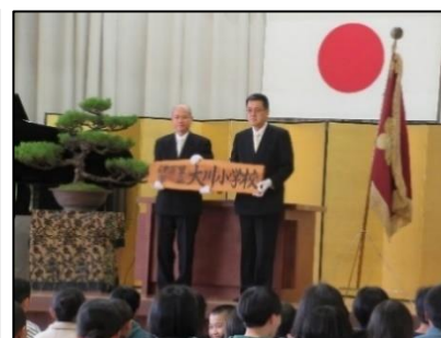
校旗と学校表札の返納