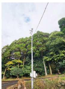
↑東分区の屋外放送設備の一部