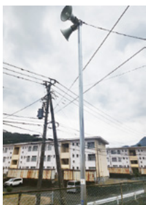
↑福住区の屋外放送設備の一部