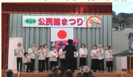
▲ 南ヶ丘シニアクラブのみなさんによる 芸能発表 コーラス『いい日旅立ち』