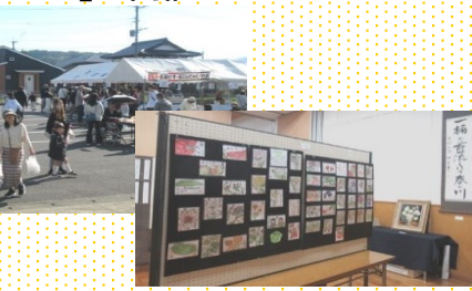
▲ 食品バザーや作品展の時間にも楽しんでいただきました

11月16日(日)当日は天候にも恵まれ、300名を超える方々にご来場いただきました。式典では3組のご夫婦に金婚祝賀状が贈られました。また、各地区の自治公民館長として長年貢献された2名の方に感謝状が贈られました。会場では、芸能発表会、作品展示、食品バザー、子ども向けの射的など、多くの皆さまに楽しんでいただきました。ご来場いただいた皆さま、開催にご協力いただいた関係者の皆さまに心より感謝申し上げます。『文房具ドライブ＆フードドライブ』へのご協力ありがとうございました。いただいた物品は市内のNPO法人に寄贈しました。