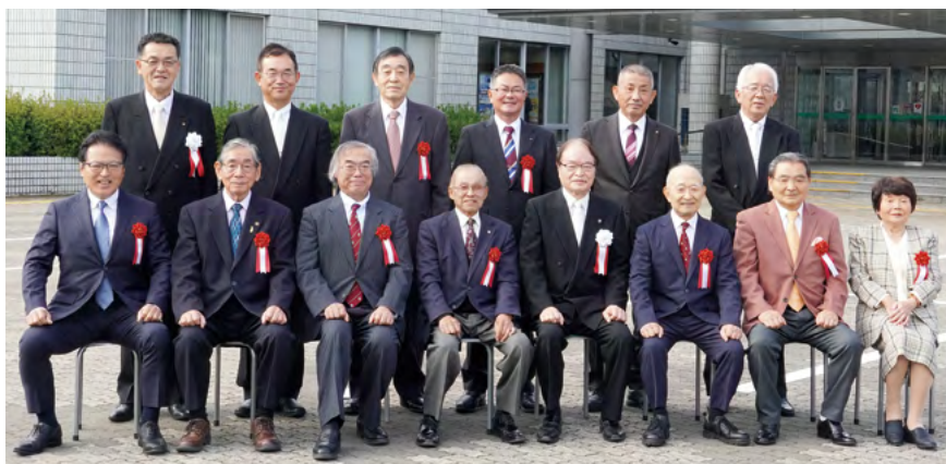
↑ 市政功労者・善行者表彰受賞者の皆さん