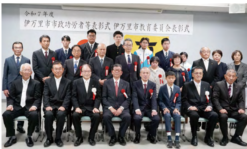
↑ 教育委員会表彰受賞者の皆さん