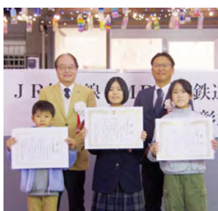
↑ 表彰式に参加した受賞者の皆さん（前列）