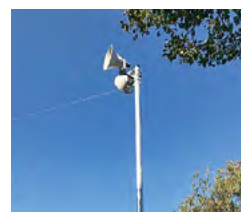
↑ 整備された屋外放送設備の一部