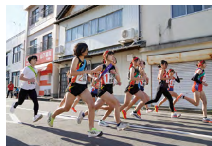
↑選手たちは、再スタート地点の山下薬局松島店前を勢いよく駆け出しました

今大会は、14区間・総距離58・6 キロ で行われ、伊万里地区が見事3年連続の優勝を果たしました。