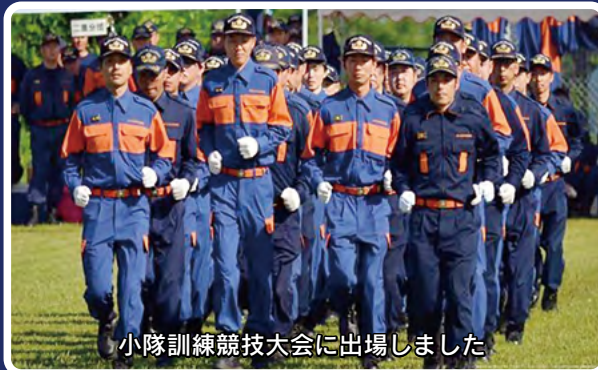
小隊訓練競技大会に出場しました