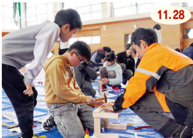
↑ 講師のアドバイスを受けながら、友だちと協力して懸命に釘を打ち、1人1台の万能台を完成させました

山代東小学校で『木育教室』が行われました。これは、市内の小中学生に木と触れ合ってもらい、森林の大切さなどを学んでもらおうと森林環境譲与税を活用して行っている事業で、この日は、5年生14人が参加し『森林と私たちの暮らし』についての座学を受けたり、講師のアドバイスを受けながらの万能台づくりに挑戦したりしました。児童たちは、木の香りや手触りを感じながら、木との触れ合いを楽しんでいました。