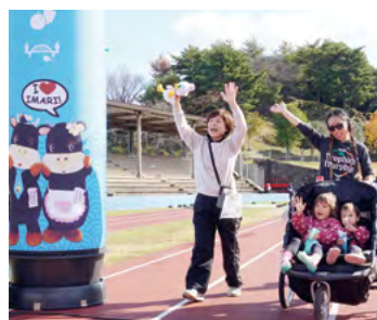
↑参加者は手を振りながら笑顔でゴールしていました

秘窯の里・鍋島コースの参加者は、開窯350周年を迎えた鍋島焼文化に触れながら、大川内山の赤や黄色に色づいた木々の美しさなどを感じつつ歩いていました。古伊万里コースの参加者は、