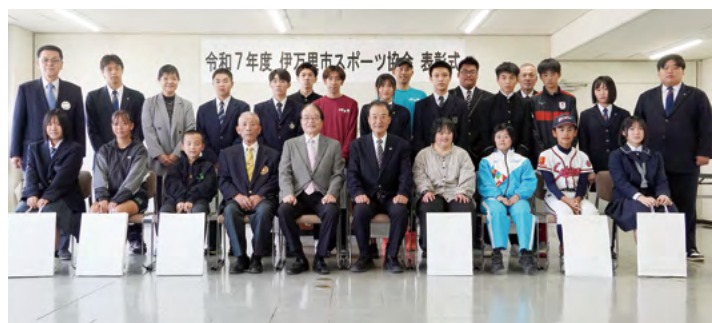
↑今年度は、スポーツ功労者表彰1個人、スポーツ賞21個人・8団体が受賞しました