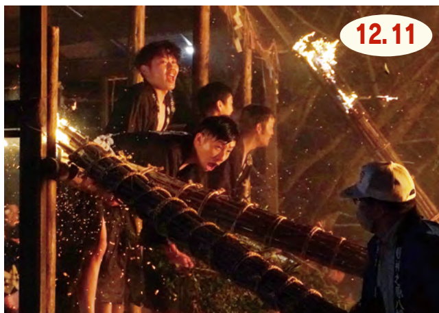
↑ 燃え盛る松明の火の粉をものともせず、威勢の良い掛け声をあげながら、激しい攻防を繰り広げていました

12月最初の卯の日前夜に、二里町大里の神原八幡宮で『取り追う祭り』がありました。これは、松明を手に、火の粉を散らしながら『御供さん』と呼ばれる握り飯を奪い合い、五穀豊穡や無病息災を祈願するもので、南北朝時代に起源を持つとされています。守り手と攻め手に分かれて激しくぶつかり合う迫力ある光景に、大勢の人が駆けつけ、伝統行事ならではの熱気に包まれていました。