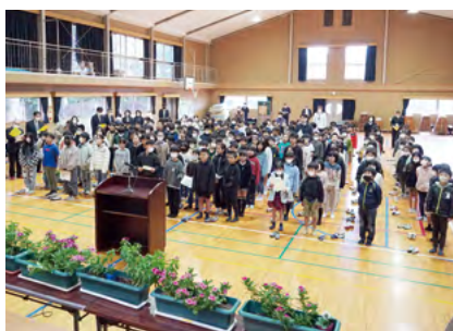
↑きれいに咲いている花々を前にして『ありがとうの花』を歌いました

『人権の花』運動とは、年間を通して花の植栽や管理を通じて、児童の思いやりや協力する心を育てようと、唐津・伊万里人権啓発活動地域ネットワーク協議会が、小学生を対象に行っているものです。