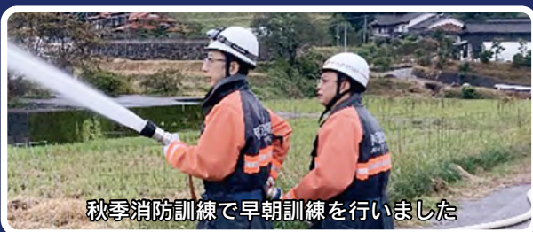
秋季消防訓練で早朝訓練を行いました

また、秋季火災予防運動期間中に行う早朝訓練は、ポンプ連結による放水訓練など、より実践的な訓練に取り組み、消防団の役割や重要性を地域へ広めています。