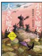
『小さい魔女と大きい魔女』～ローズと汚れた海～ 岡田 晴恵／作 佐竹 美保／作 ポプラ社

年に1度のワルプルギスのお祭りでは、大勢の魔女たちが踊ります。魔女は何百年、何千年も生きる大きい魔女から、小さい魔女までさまざま。小さい魔女は、大きい魔女に弟子入りし、1人前を目指します。