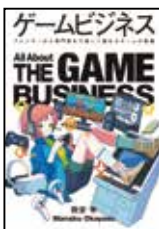
『ゲームビジネス』 岡安 学／著 クロスメディア・パブリッシング

お祭りの後、魔女のお頭による緊急会議が始まりました。水晶玉には、地球の自然が壊れた、近未来の姿が映しだされ、魔女たちは声を上げました。それを小さい魔女のローズが足元で見ていて…。