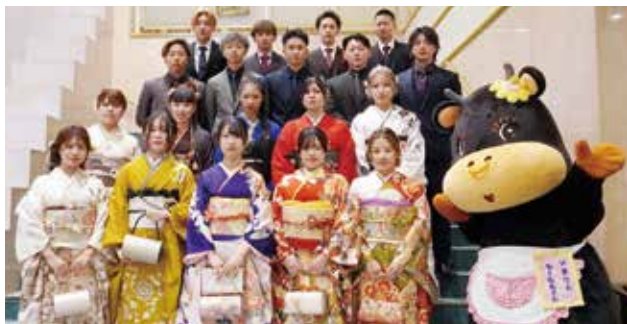
↑ 式の前に記念写真に納まる実行委員の皆さん

二十歳の集いの企画や運営などを行ったのは、各地区・町から選出された20歳の代表者22人からなる実行委員です。実行委員は、みんなの思いに残る式典にしようと、昨年7月から企画会議を5回開催するなど、熱心に話し合いを重ね、協力しながら準備に取り組みました。