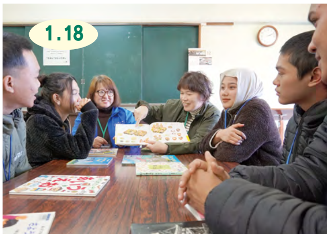
↑市内の絵本専門士が選んだ絵本の読み語りがあったほか『おせんべえやけたかな』などの手遊びが行われました

生涯学習センターで、市内在住の外国人に、日本の生活習慣や風習に関心を持ってもらおうと『えほんでまなぶ日本』のワークショップが行われました。これは、市教育委員会が、文部科学省から委託された『図書館・学校図書館と地域の連携協働による読書のまちづくり推進事業』の一環として開かれたものです。参加者たちは、日本語教室いまりのボランティアが語る絵本を見た後、行事や言葉の説明を聞いて、理解を深めていました。