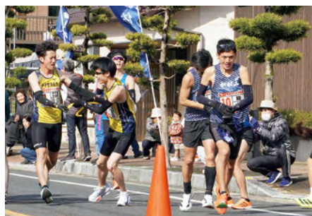
↑大坪コミュニティセンター前で懸命にたすきをつなぐ選手たち