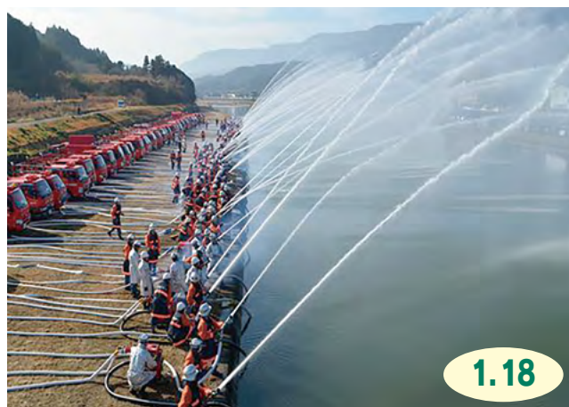
↑有田川河川敷で、各地区の消防団員たちが、一斉に放水を行いました

二里小学校で、屋外での開催は6年ぶりとなった『令和8年伊万里市消防出初式』が行われました。出初式は、消防団員の士気高揚を図り、市民の防災意識を向上させようと毎年行われているもので、観閲式や通常点検、分列行進が実施されました。式典終了後は、有田川河川敷で一斉放水が行われ、参加者は、日頃の訓練の成果を披露しながら、地域の安全を守る決意を新たにしていました。