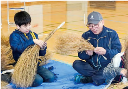
↑他に同じものがない自分だけのほうき作りに、児童たちは真剣に取り組んでいました

児童たちは、地域の人たちの手ほどきを受けながら、刈り取られた長さ約1坪のコキアに、麻糸を丁寧巻き付けて持ち手を作り、最後に靴下をかぶせて、ほうきを仕上げました。