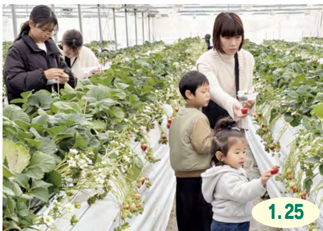
↑参加者は、園内に広がるあま〜い香りも味わいながら、いちご狩りを楽しんでいました

東山代町で、市と市観光協会が、自然や食文化の魅力を伝えようと実施している『グリーン・ツーリズム体験イベント』の一環として、本イベントを開催しました。参加者は、LCファームでいちご狩りを楽しんだ後、伊万里菓舗うちださんの指導を受けながら、収穫したばかりのいちごを使ったタルト作りに挑戦し、地産地消の大切さを感じつつ、笑顔で体験を楽しんでいました。