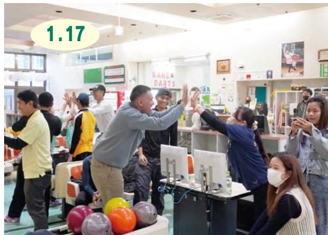
↑外は寒かったですが、会場は、熱気や歓声、笑顔などであふれ、ハートウォーミングな雰囲気に包まれていました

Awesome: 英語で『素晴らしい』『最高』『すごい』の意味 伊万里スターボウルで、市内在住の外国人に、スポーツを通じて交流し、友好を深めてもらおうと新春ボウリング大会が行われました。これは、市が、市国際交流協会に委託している地域日本語教室『オーサム・イマリ』の活動の一環として開かれたもので、約70人が参加しました。参加者たちは、ストライクやスペアを取るとハイタッチをして喜び合ったりするなど、心ゆくまでプレーを楽しんでいました。