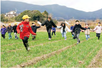
↑雪がちらつく寒空の下でも、児童たちは元気いっぱいに麦ふみ体験を行いました

この日は、東山代小学校の2年生50人が参加し、みんなを手をつないで走ったり、跳んだりしながら、丈夫に育つような元気いっぱい麦ふみを行いました。同校は、運動場が整備中で使用できない状況もあり、児童たちは、広い麦畑を運動場代わりに、のびのびと走り回っていました。