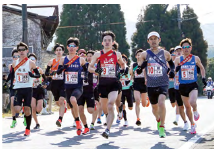
↑全チームが一斉に伊万里梨選果場前を再スタートし後半戦が始まりました