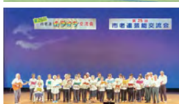
↑グラウンド・ゴルフ大会(上)と芸能交流会の様子