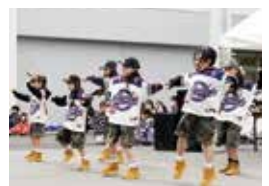
キッズダンサーのダンス公演 (右)