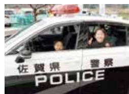
はたらくのりもの広場でパトカーに乗車した子どもたち (中央)