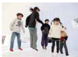
ふわふわドームで遊ぶ子どもたち (左)