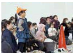
ステージショーは大盛り上がりでした