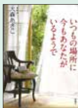
『いつもの場所に今もあなたがいるように』