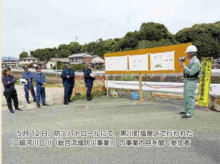
5月12日、防災パトロールにて、黒川町塩屋区で行われた「二級河川立川（総合流域防災事業）」の事業内容を聞く参加者