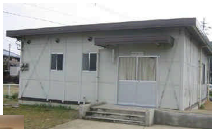
参考：二里児童クラブ専用施設