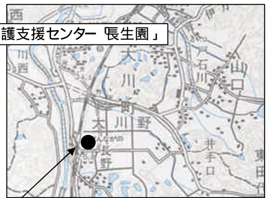
地域型在宅介護支援センター「長生園」