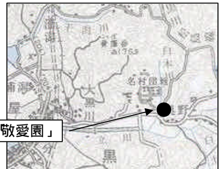
地域型在宅介護支援センター「敬愛園」