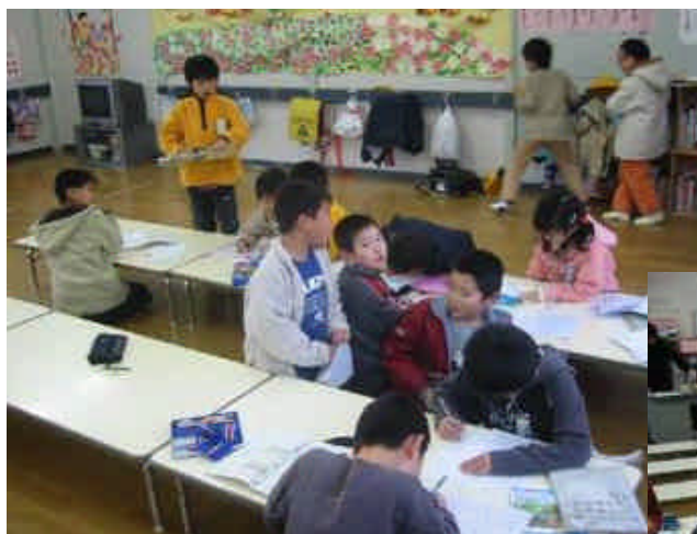
大坪児童クラブの様子