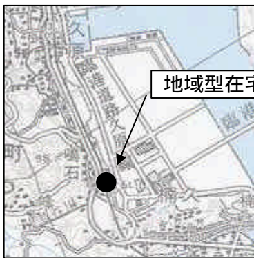
地域型在宅介護支援センター「西光苑」