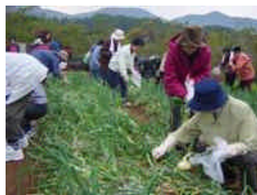
タマネギの苗植え体験 (H16.12.8)