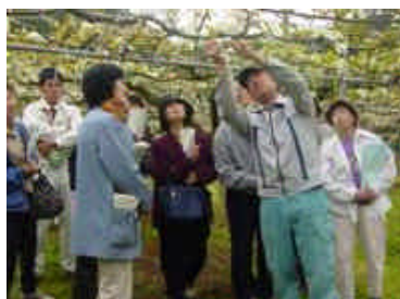
「伊万里の梨園」で生産者と意見交流 (H16.4.14)