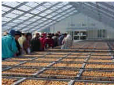
「JA伊万里梅一次加工施設」視察 (H16.10.18)