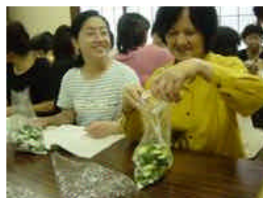
キュウリの簡単漬物作り体験 (H16.7.8)