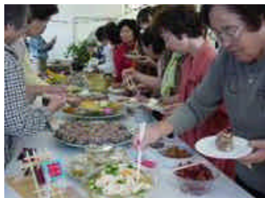
「トントン祭りを“食”で楽しもう～おくんち料理の試食交流～」 (H16.10.18)