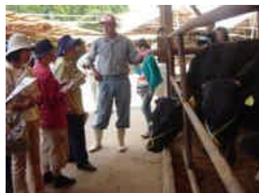
「伊万里の牛舎」で生産者と意見交流 (H16.8.20)