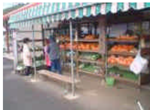
山代東部ふれあい販売所等の農産物直売所からの販売促進

新たな農業経営を目指して 個人経営から集落営農へ展開し、計画的営農と所得向上を目指す。