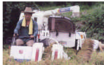
それぞれの地域特性にあった集落営農を目指す

新たな農業経営を目指して 個人経営から集落営農へ展開し、計画的営農と所得向上を目指す。