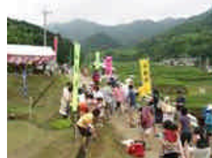
すみやま田植え祭での都市住民との交流

都市住民との交流促進を目指して 地域資源を活用し、都市住民との交流を図り、農産物等のアピールを行う。