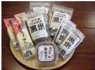
黒米による農産加工品 (みそ、ようかん)

地産地消を目指して 消費者ニーズに対応した安全安心な多種多様な農産物と農産加工品を提供する。