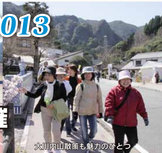
大川内山散策も魅力のひとつ