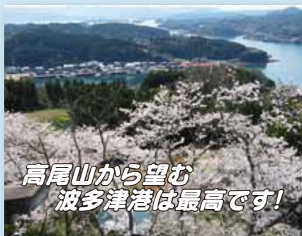
高尾山から望む 波多津港は最高です!