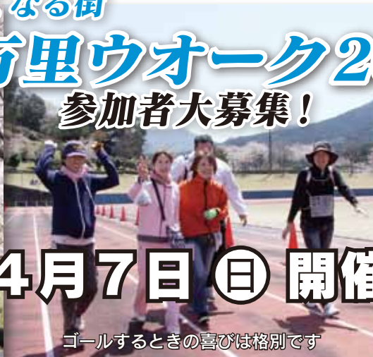
ゴールするときの喜びは格別です