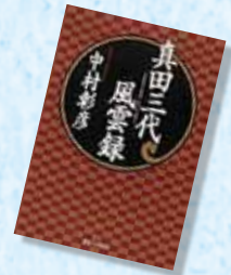
『真田三代風雲録』 中村 彰彦 / 著 実業之日本社

戦国時代の武将の中でも絶大な人気を誇るのが、真田家の猛者たちです。真田家を復興させた真田幸隆は、武田家の軍師として活躍した名将で「攻めの弾正」と呼ばれました。「表裏比興の者」と言われた昌幸、「日本の兵」と評された幸村。熱き戦国の世を生き抜いた英雄たち、真田家三代の物語です。