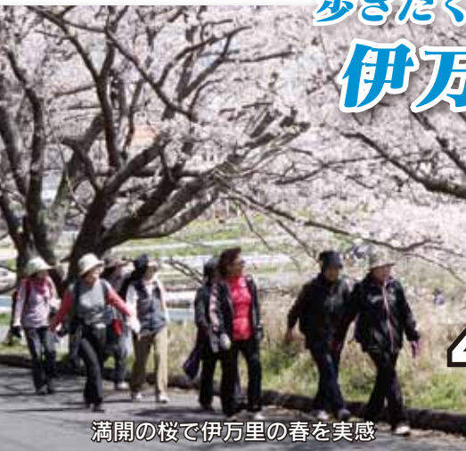
満開の桜で伊万里の春を実感