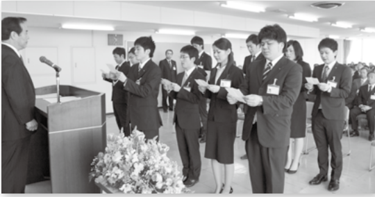
↑ 塚部市長(左)に宣誓を行う新規採用職員

市は、4月1日付けで機構改革と人事異動を行いました。 今回の異動は、市政の重要プロジェクトとして、甲子園出場をテーマとする地域振興の促進や有田川浄水場更新事業の円滑な推進を図るために、組織・機構を見直すとともに、業務状況に応じた退職不補充などの適正な定員管理を行う中で、女性職員の登用、F A制度による異動、長期在職者の解消などによって、職員の意識改革の促進と資質の向上をめざした人事配置を行いました。