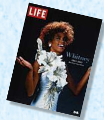
『ホイットニー・ヒューストン 1963-2012』 びあ

ゴスペル・シンガーの母を持ち、幼い頃から教会で歌うなどして歌唱力を磨き才能を開花させたホイットニー・ヒューストン。『歌姫』と呼ばれ、その歌声は世界中を魅了し、また、女優としても活躍しました。波乱万丈とも言われる彼女の48年間の生涯をまとめた写真集です。