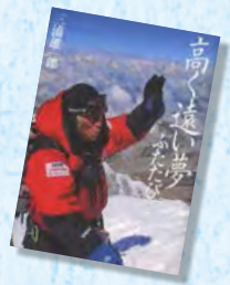
『高く遠い夢 ふたたび』 三浦 雄一郎/著 双葉社

著者は、今年5月に80歳の世界最高齢で3度目のエベレスト登頂を果たしました。65歳のとき、エベレスト登頂を決意し、手術や不整脈との戦いを経て、2度の登頂を達成します。あきらめずに夢を見続ける著者のエベレストへのこだわりや、常に死と隣り合わせの過酷な挑戦を綴った登頂記です。