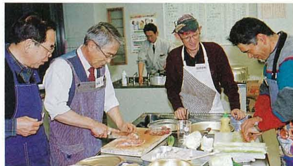
鍋料理に挑戦中の昨年の料理教室のようす