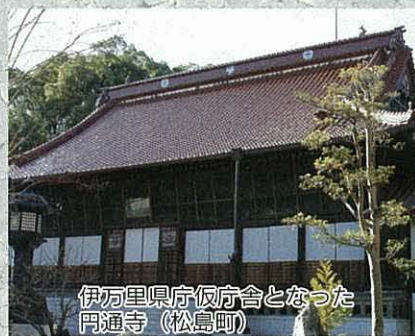
伊万里県庁仮庁舎となった円通寺(松島町)

直後に、有田郷の農民は反対の嘆願書を県庁に出しました。また3月から5月にかけて、農民たちは暴動を起こし、西松浦郡内では6月に有田郷の農民20人ほどが厳しい取り調べをつけています。その6月、佐賀県(5月に伊万里県は佐賀県に変わった)は伊万里郷の農民の嘆願書を焼き捨てたという張り紙を出し、強硬姿勢を示しました。しかし、その後も暴動