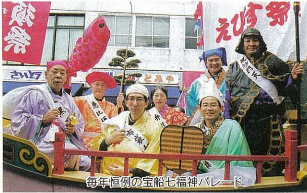
毎年恒例の宝船七福神パレード