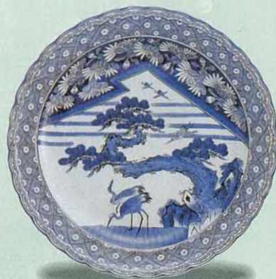
伊万里 1810~1830年代 高さ5.8cm 口径46.9cm 底径26.5cm