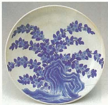
そめつけいわやまぶきもんざら 染付岩山吹文皿