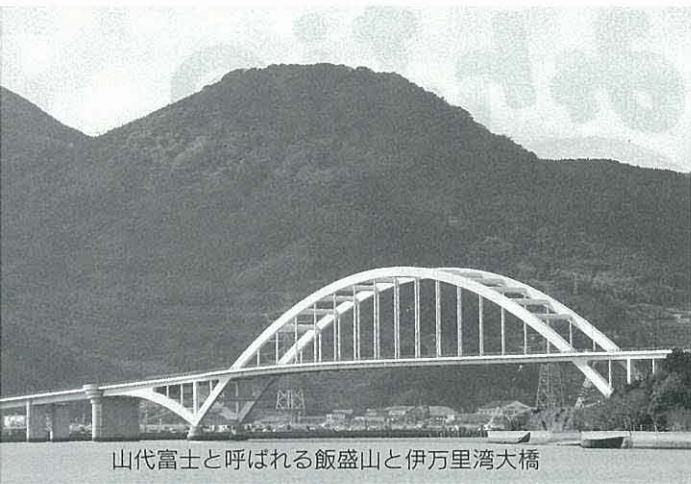
山代富士と呼ばれる飯盛山と伊万里湾大橋