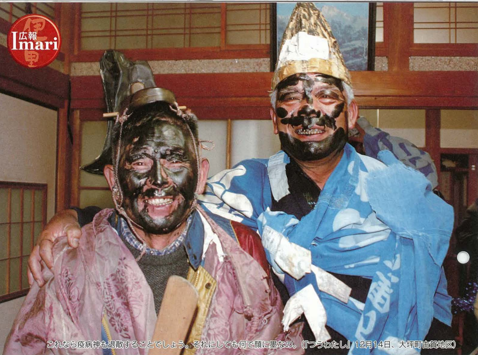
これなら疫病神も退散することでしょう。それにしても何で顔に墨なの。(『つうわたし』12月14日、大坪町古賀地区)