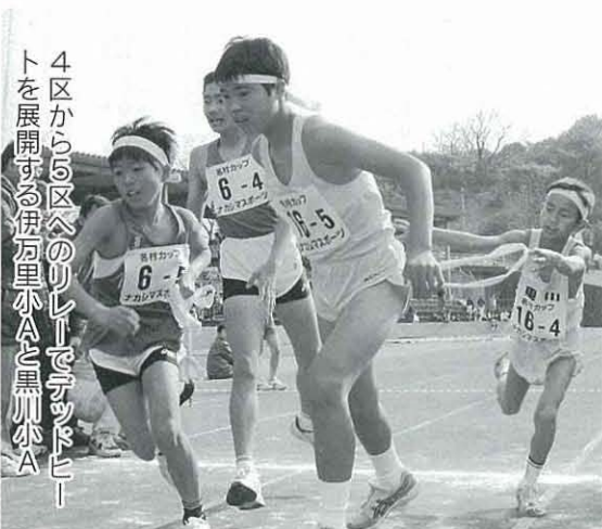
4区から5区へのリレーでデッドヒートを展開する伊万里小Aと黒川小A

男女合わせて約200人、駅伝の部に男子40チーム、女子23チームが参加。駅伝の部男子では、前半上位3チームがデッドヒートを展開しますが、最終安定した走りを見せた伊万里小学校Aが5連覇を