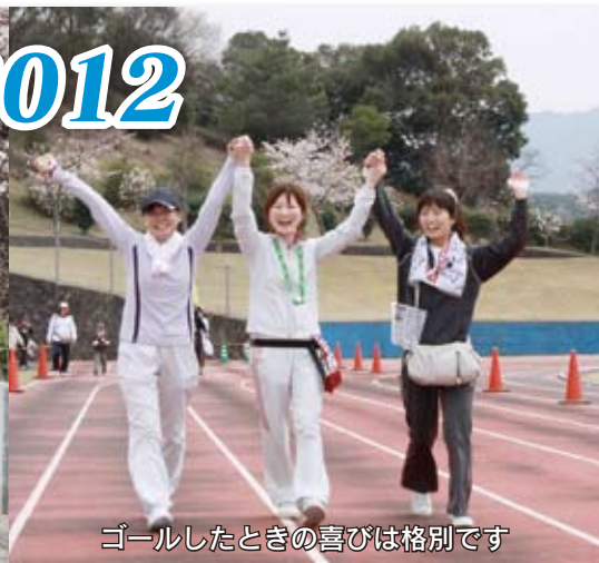
ゴールしたときの喜びは格別です