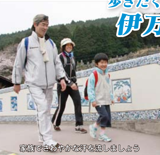
家族でさわやかな汗を流しましょう