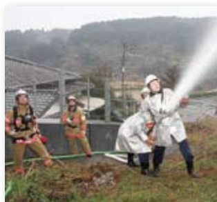
↑昨年実施された消防訓練の様子(大川内町)