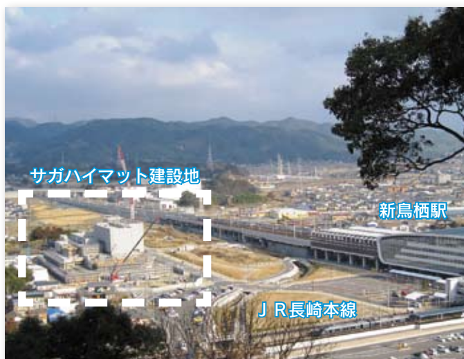
↑サガハイマツトの建設状況(1月11日現在)