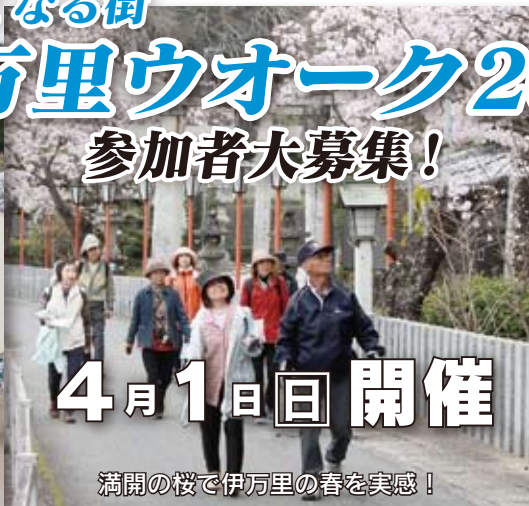
満開の桜で伊万里の春を実感!