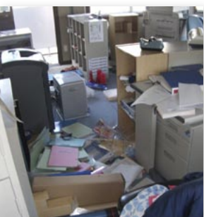
↑地震直後の事務所内