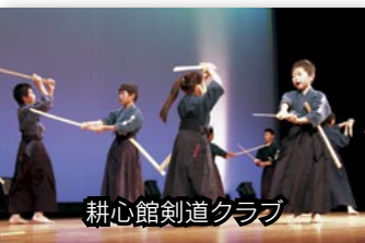
耕心館剣道クラブ