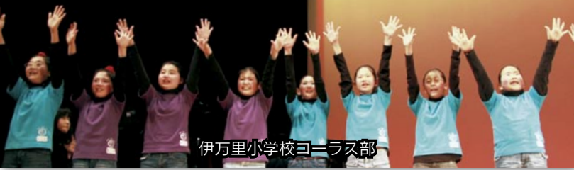
伊万里小学校コーラス部

3月5日、児童・生徒が音楽や踊りなどを発表する『2011 キッズフェスティバル』が市民センターで開催されました。市内の園児から高校生までの8団体、約150人が、日ごろの練習の成果を披露しました。