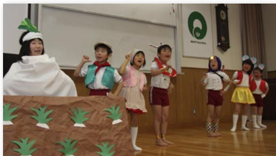
松浦保育園児たちが熱演した『大きなかぶ』のオペレッタには会場から温かい拍手が湧きました

や、同校図書委員会が勧める本の紹介、松浦保育園児らによるオペレッタなど盛りだくさんの内容でした。 なかでも、地元ボランティアグループ『おはなしとつくくん』による絵本や紙芝居の読み聞かせは大好評。着ぐるみで演じた『ちびくろさんぼ』で会場は大いに盛り上がりました。 メインイベントとして、家読に取り組む3家族によるパネルディスカッションが行われ、「今の子どもたちは部活や塾などで忙しい。親子のコミュニケーションをとるためにもできるだけ家読の時間をつくりましょう」という意見が出るなど、お互いに家読の重要性を確認し合いました。