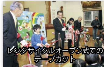
レンタサイクルオープン式でのテープカット