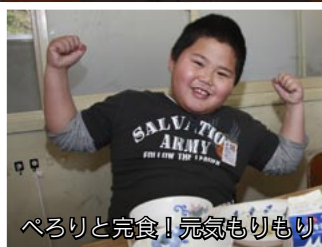
ぺろりと完食! 元気もりもり