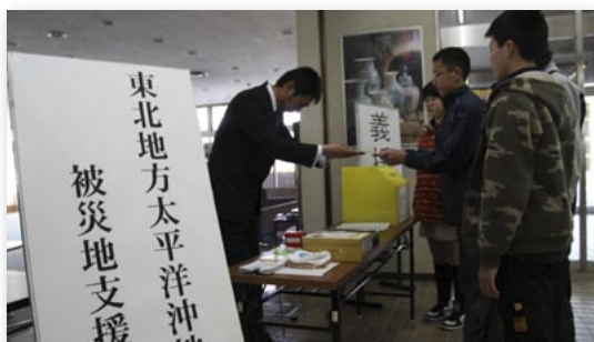
↑自分たちで集めた義援金を手渡す立花小の児童

消防職員5人と消防ポンプ車1台を派遣。被災地の救急救助活動および災害支援活動を行いました。