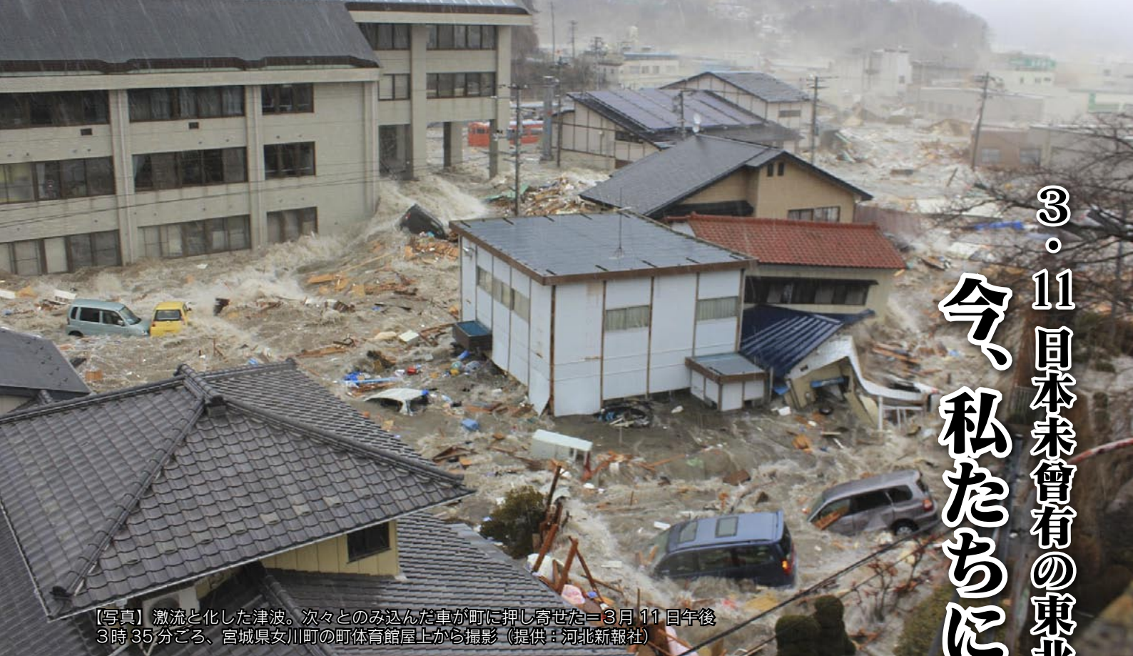
【写真】激流と化した津波。次々とのみ込んだ車が町に押し寄せた＝3月11日午後3時35分ごろ、宮城県女川町の町体育館屋上から撮影

現在、福島県の友人の話では、スーパーやコンビニの商品はすべて品切れで、特にガソリン、灯油がない状態。そういう厳しい状況におかれながらも「無事に帰れてよかった」「戻ってきたらダメよ」という温かい言葉をかけてくれる友人たちのやさしき、強さに涙が止まらなかったといいます。「被災地の人たちのことを思い、義援金や支援物資、節電・節水など、一人ひとりが今できる支援を行っていくことが復興への大きな力となっていくと信じています」と、涙ながらに語られていました。