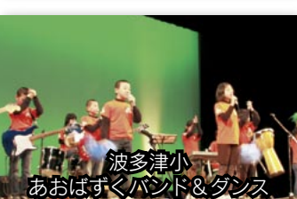
波多津小 あおはずくバンド&ダンス