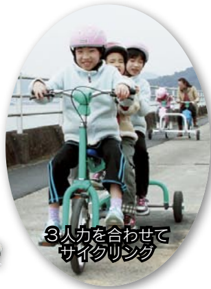
3人力を合わせてサイクリング