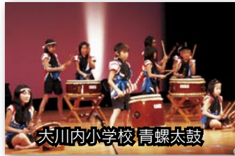
大川内小学校 青螺太鼓