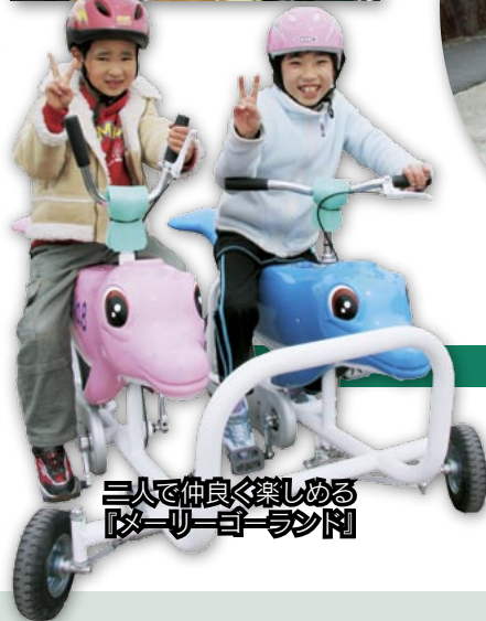
3人で仲良く楽しむ「3人乗りサイクル」