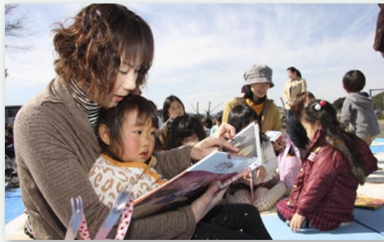
↑青空の下で、親子で絵本を楽しみました

3月5日、「本とあそぼう全国訪問おはなし隊」が、市民センターを訪問しました。これは、出版社の講談社が子どもたちに本に親しんでもらおうと