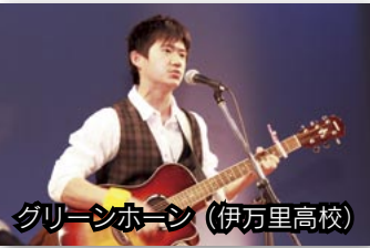
グリーンホーン (伊万里高校)