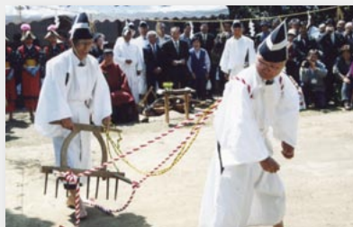
昔ながらの農具を用いて田植えの所作を行う様子

大御田祭は、12年に一度の申年の旧暦3月申日に、大坪町白野の山王神社で行われます。近年では、平成16年(2004)の4月11日に本祭りが行われました。 本祭りでは、まず拜殿内で御祓いの後、申年生まれの子どもたち8人(演奏4人の男の子、舞手4人の女の子)が浦安の舞という神楽を奉納します。 山王神社のつかいが猿なので、申年生まれの子どもたちが奉仕するのだといわれています。 その後、境内で御祓いの後、烏帽子をかぶった白装束の男たちが、昔ながらの農具を用いて、田うち、田起こし、代かき、苗代ならしの所作を行います。 また、菅笠をかぶり、たすき掛けの早乙女姿の女性たちが、種まきと田植の所作を行います。 実際の田植えの前に、田植えの動作を前もってすることで、田植えがうまくいき、豊作になるとされています。 稲作は、日本の農業の中でも特別で、さまざまな伝統行事があります。 大御田祭は、農作業が本格化する前に、あらかじめ豊作を祈る予祝行事です。