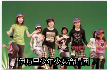
伊万里少年少女合唱団