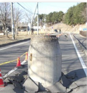
↑突き出たマンホール