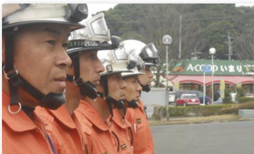
↑被災地へ向かう伊万里市消防署の隊員

3月14日、消防庁長官からの出動指示を受け、被災地の災害支援のために、緊急消防援助隊(佐賀県隊)が出動しました。この緊急消防援助隊は、県内の各消防局や消防本部の職員50人により編成され、伊万里市消防本部からは