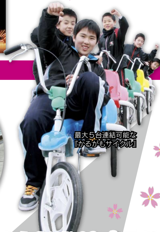
最大5台連結可能な「かるかもサイクル」