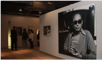
↑閉館を名残り惜しむ入館者（写真奥）

閉館までの3月4日から3日間の無料開放では、巨匠、故・黒澤明監督のゆかりの映画資料の見納めとあって、県内外から1000人が訪れ、別れを告げていました。