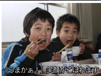
「うまかあ!」笑顔がこぼれます