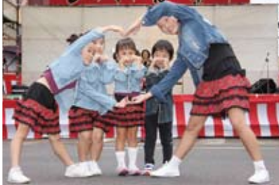
↑ スタジオ ZOO による可愛いダンス