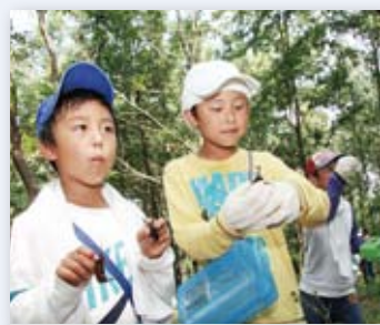
↑『昆虫採集会』で、カブトムシなどを捕まえた子どもたち

しいチョウやカブトムシなどを真剣に観察していました。この昆虫展の開催に合わせ、期間中には昆虫に関連するイベントが行われました。7月24日、大川町のクヌギ林で『昆虫採集会』がありました。参加した家族連れは、カブトムシなどお目当ての昆虫がいなかクヌギ一本一本を丁寧に探索。見つけるたびに歓声をあげていました。