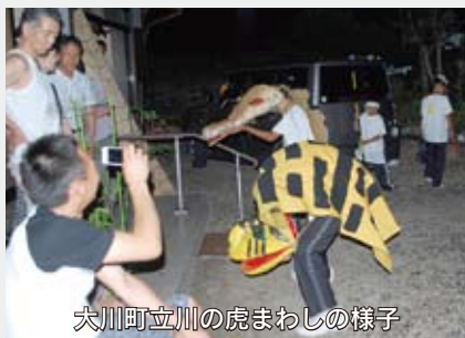
大川町立川の虎まわしの様子