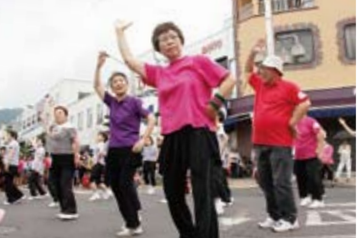
↑ 軽やかな動きのリズムダンス