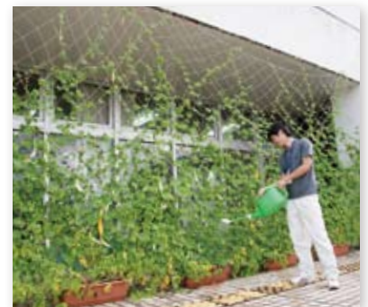
↑市職員が市役所庁舎で取り組んでいるみどりのカーテン

※基準年以降に新規に建設された施設または増改築された施設は数値目標を設定せず、可能な範囲で最大限環境に配慮し、二酸化炭素などの削減に努めます