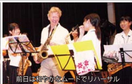
前日は和やかなムードでリハーサル