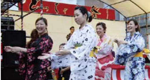
↑ 約500人の皆さんが『みんなで踊ろう』に参加