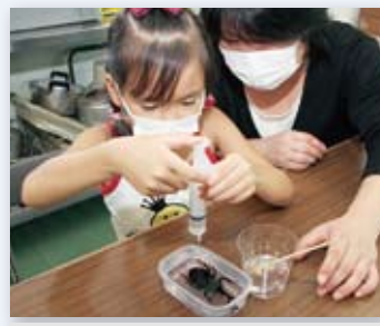
↑『甲虫標本教室』では注射器で慎重に樹脂を流し込みました