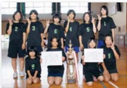
↑優勝した牧島地区の漁港・釘島子ども会(左)と大川町の立川子ども会(右)