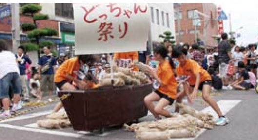
↑ 積出港を再現！子ども会による『運びレース』