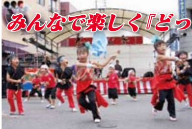
↑ 元気いっぱいの波多津保育園児たち