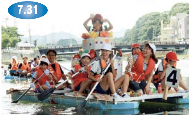
↑かけ声にあわせ、力をあわせて手づくりのいかだを漕ぐ児童たち