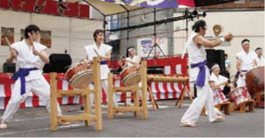
↑ 伊万里太鼓の会の皆さんが『入船』を力強く演奏