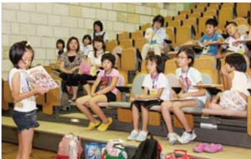
↑おはなし会で絵本の読み語りに挑戦する児童

参加した市内の小学生19人は、書架整理や本の貸出業務など盛りだくさんの必須講座のほか、おはなし会の実演や布の作品づくりの選択講座にチャレンジ。最初は慣れない体験に戸惑っていましたが、次第に楽しく交流を深めながら真剣に学んでいました。