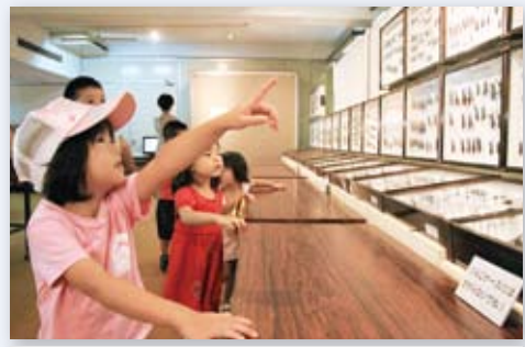
↑『昆虫展』にはたくさんの児童たちが来場

また、8月7日には生涯学習センターで『甲虫標本教室』が開催されました。この日行われたのは樹脂標本づくり。夏休みの宿題にしようと思参加した子どもたちは、クワガタなどの甲虫を透明の樹脂で固めて標本を作りました。子どもたちは、夏休み期間中、さまざまな昆虫とのふれあいを通して、命の大切さなど多くのことを学びました。