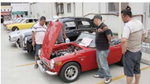
↑ 『どっちゃん旧カー』には往年の名車が勢ぞろい