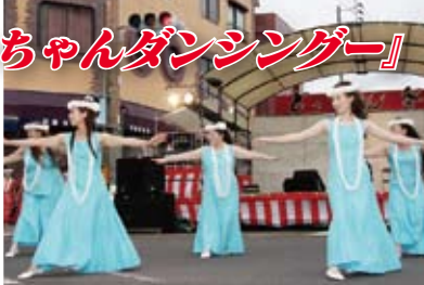
↑ 南国の雰囲気をもたせたフラダンス