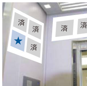
★が今回の募集箇所