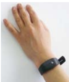
【図1】睡眠障害を簡単に検査する機器

睡眠障害はさまざまな病気を併発していることから、体にとって悪影響であることは明白です。たかがいびきと考えず、病気が潜んでいないか十分に注意する必要があります。また、就寝中のことで自覚していないケースが多いため、気になる人はかかりつけ医に相談してみてください。