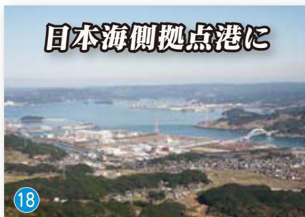
日本海側拠点港に