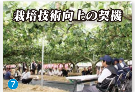
栽培技術向上の契機