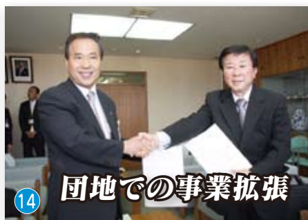
団地での事業拡張