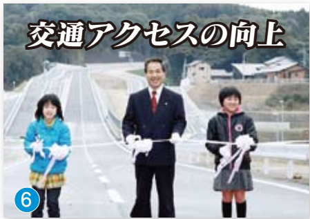
交通アクセスの向上

2011年もあとわずかで暮れようとしています。あなたにとってこの1年はどんな年でしたか。楽しかったこと、辛かったこと、2011年（平成23年）は、あなたの周りでいろいろなことがあったことでしょう。私たちの住む、この伊万里市でもいろいろな出来事や話題がありました。ここでは、2011年という年が伊万里市にとってどんな1年だったのか、主な出来事や話題を『広報伊万里』とともに振り返ってみます。