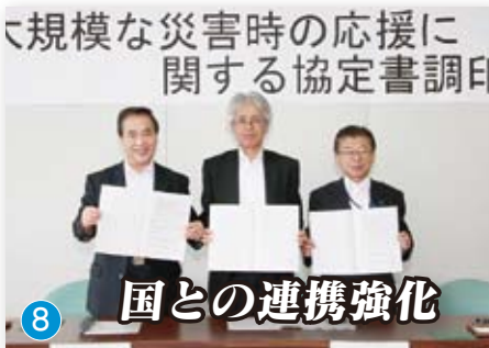
大規模な災害時の応援に関する協定書調印