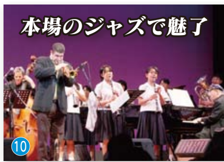
本場のジャズで魅了