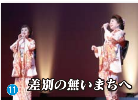
差別の無いまちへ