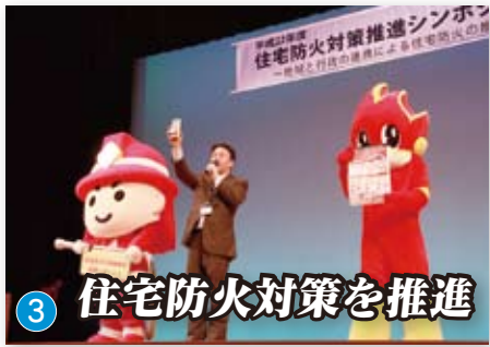
③ 住宅防火対策を推進