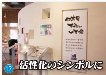
活性化のシンボルに