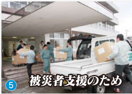
被災者支援のため