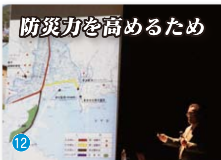
防災力を高めるため