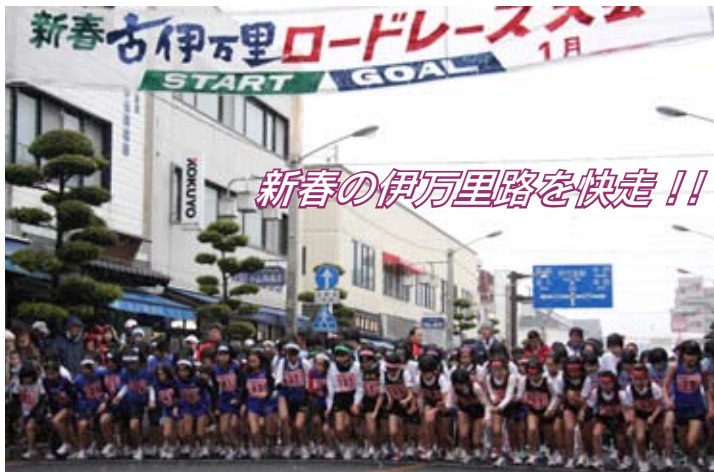
新春の伊万里路を快定!!