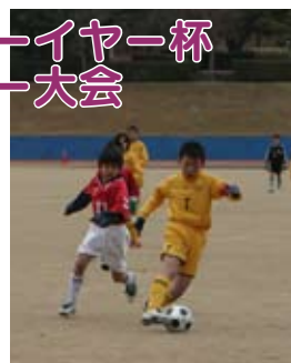
↑攻撃するFCエスペランサ

第15回伊万里ニューイヤー杯少年サッカー大会が、1月10日、11日の2日間、国見台陸上競技場などで開かれました。大会には、県内外から24チームが出場。市内からは大坪少年SC、FCエスペランサ、FC伊万里ファイターズが出場しました。予選リーグの結果、エスペランサと伊万里ファイターズが大会ベスト8となる1位トーナメントに進出しましたが、両チームともに健闘およばず2回戦進出はなりませんでした。