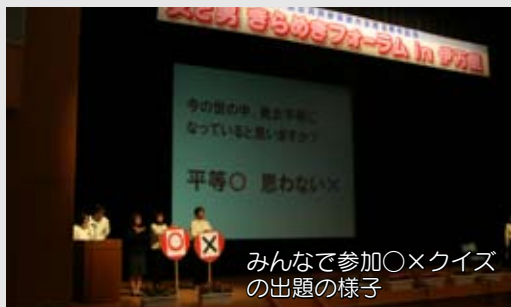
みんなで参加〇×クイズの出題の様子

講演の中で男女協働参画社会とは、お互いがお互いを認め合う社会であり、仕事だけや育児だけの『ぼつかり人生』から脱却でき、女性だけでなく男性も『あるべき像』から解放されたれ、幸せになる社会であると主張。男性、女性がともに認め合い、支え合い、ともにきらめく男女協働参画社会づくりに積極的に取り組んでいきましょうと会場を埋めた参加者に語りかけました。