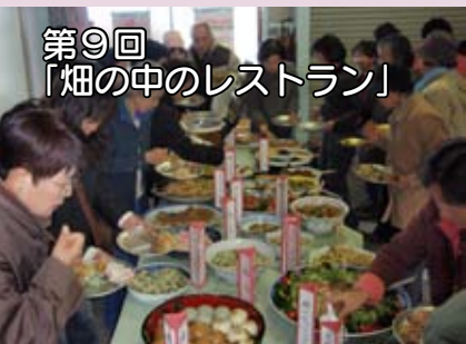
第9回 「畑の中のレストラン」