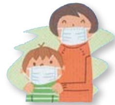
■インフルエンザ比較表

しかし、特效薬ではなくウイルスの増殖を抑えて重症化を防ぐ治療薬として使用される予定です。効果を最大限に発揮させるためには、発症から48時間以内に服用する必要があります。