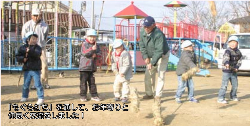
「もぐら打ち」を通して、お年寄り と仲良く交流しました！

1月14日、大川内保育園の園児120人が『もぐら打ち』でお年寄りと楽しく交流しました。 このもぐら打ちは、大川内青螺老人クラブと20年以上続く新年の交流行事で、この日、お年寄り10人が大川内保育園を訪れ、青竹の先にワラを巻いた打ち棒を園児全員にプレゼント。早速、園児たちはお年寄りと一緒に大きな輪になって、「♪14日の晩なもぐら打ち こなたのおうちの栄えるように 酒だすか餅出すか・・・♪」昔から伝わる口上を唱えながら、自分の背丈より長い打ち棒で園庭の地面を叩き、もぐら打ちの練習を楽しみました。