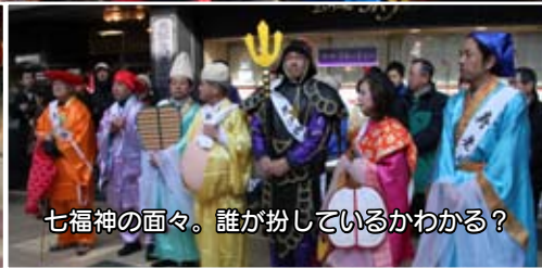
七福神の面々。誰が扮しているかわかる？