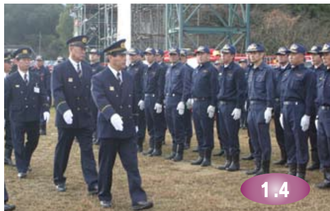
↑塚部市長らの観閲を受け、リリしい表情の消防団員たち

新春恒例の伊万里市消防出初式が消防本部訓練場で開かれました。この日参加したのは市内12分団の消防団員総勢829人。寒風吹き荒ぶ中、団員たちは高らかに響く号令のもと、災害のない1年となるよう願いを込めて整然と行進。詰めかけた人たちの前で、機敏な一糸乱れぬ分列行進を披露し、災害から地域を守る決意を示しました。