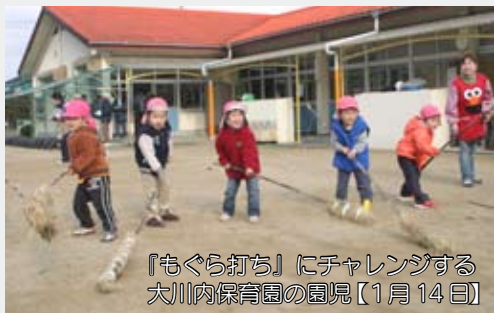
『もぐら打ち』にチャレンジする大川内保育園の園児【1月14日】

もぐら打ちは、市内全域の農村部を中心に、1月14日の夕方に行うことが多いようです。子ども中心の、あらかじめ、その年の豊作を祈る予祝行事です。唄にあわせて家のまわりの地面を棒で打ち、農作物に害をなす、もぐらを追い払うとされています。