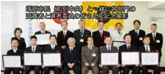
塚部市長（前列中央）と一緒に各部門の受賞者と選考委員の皆さんが記念撮影

第4回伊万里市都市景観賞を募集したところ、15点の応募がありました。応募作品について、選考委員による審査を行い、伊万里市の都市景観として優れた作品3点を決定しました