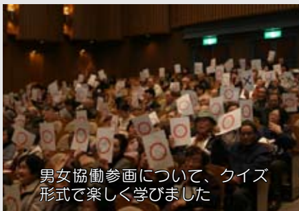
男女協働参画について、クイズ形式で楽しく学びました