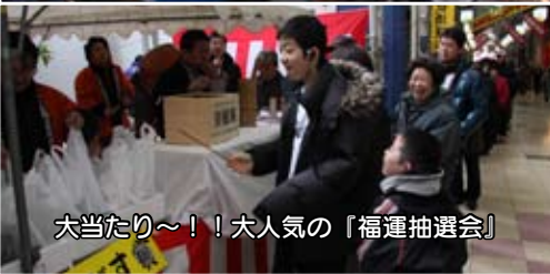
大当たり～！！大人気の『福運抽選会』